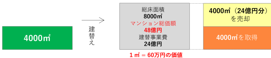
【図3-C】建替事業費はAと同じで、総価額が大きくなった例