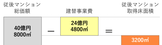
【図2】従後マンション取得床面積の算出方法

従後マンションの価値は1㎡ = 50万円（40億円 ÷ 8000㎡）となるので、施主である建替組合が建替事業費24億円を捻出するには4800㎡をデベロッパーに売却すればよいことになります。よって、建替組合として取得できる床面積は3200㎡（= 8000㎡ - 4800㎡）となります。