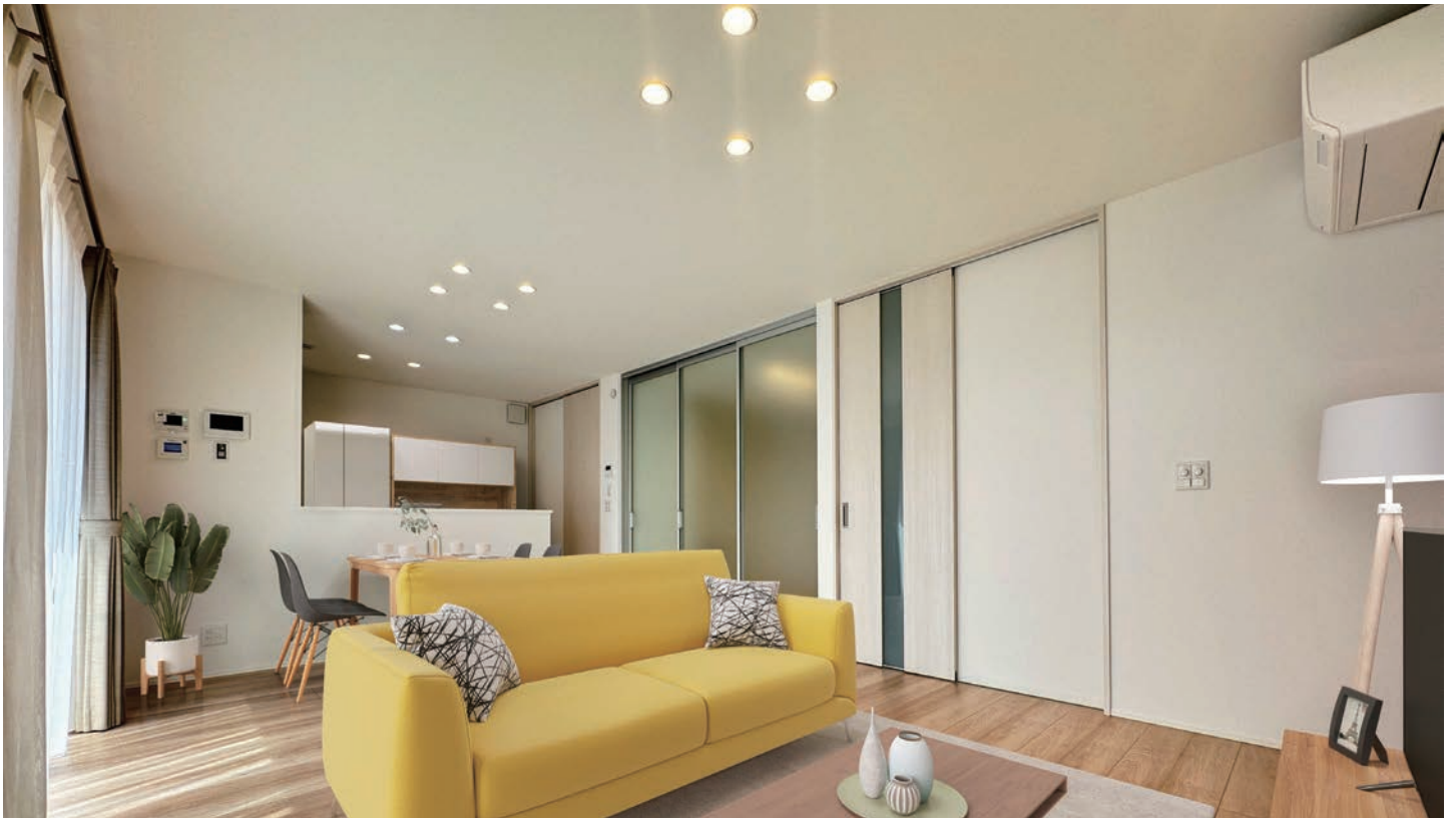
8号地内観写真(2024年3月撮影)

※写真内の家具・家電・備品等はCG加工により配置例を示したもので販売価格に含まれません。