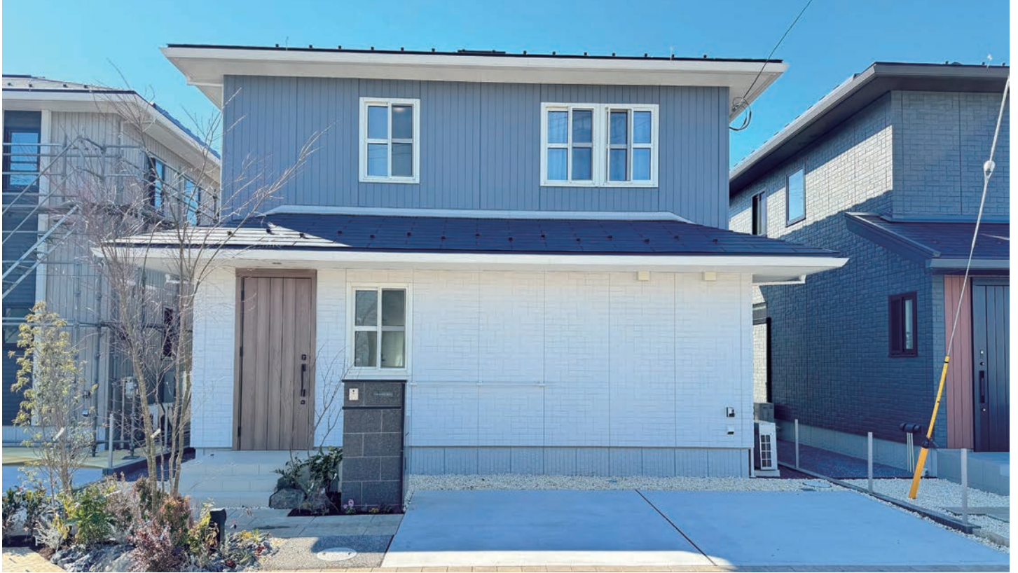
8号地外観写真(2024年2月撮影)

■敷地面積 / 181.77㎡(約54.98坪) ■延床面積 / 104.51㎡(約31.61坪) ■1F床面積 / 55.65㎡(約16.83坪) ■2F床面積 / 48.86㎡(約14.78坪)