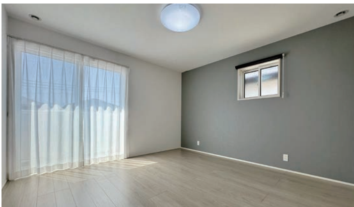
4号地内観写真(2024年3月撮影)