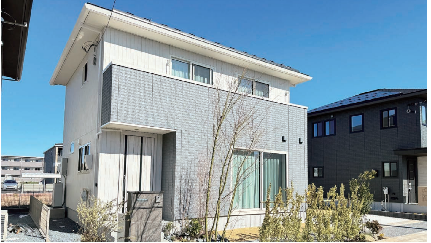
4号地外観写真(2024年2月撮影)

■敷地面積 / 182.79㎡(約55.29坪) ■延床面積 / 102.85㎡(約31.11坪) ■1F床面積 / 53.99㎡(約16.33坪) ■2F床面積 / 48.86㎡(約14.78坪)